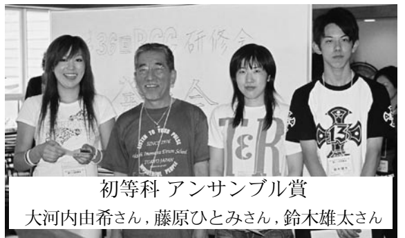
初等科 アンサンブル賞

そして迎えたコンテスト当日。講師として初参加の私も後方からドキドキしながら見守っていましたが、実際始